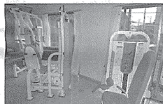
▲「介護予防」の担い手は誰に (写真はイメージです)

全国一律では十分な対応困難な見直しは、改正意見の中でもかなりのページを割かれた「地域支援事業の見直し」に伴い実施されるものだ。改正意見では、「要支援者は生活支援のニーズが高く、その内容も配食・見守りなど多様。これらに